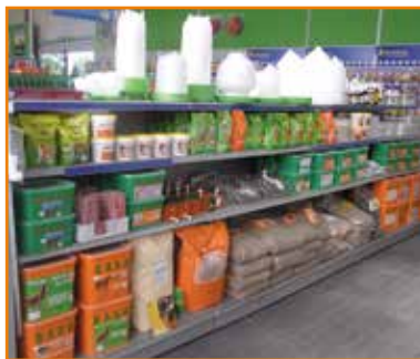
Produktpräsentation im Blütenhaus Gera

So können wir den optimalen Einsatz unserer Produkte, zur vollen Zufriedenheit von Händlern und Kunden, garantieren.