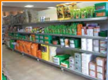
Produktpräsentation im Blütenhaus Gera

Für die Sicherheit unserer Produkte steht der Einsatz von Erzeugnissen, die nach QS zertifiziert sind.