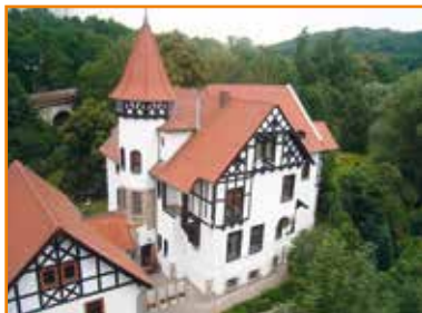
Bürogebäude in Bad Sulza