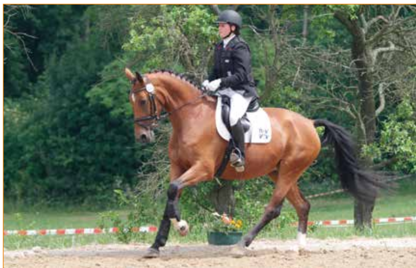
Vielseitige Pferdezucht des Gestüts „Käfernburg“ in Arnstadt